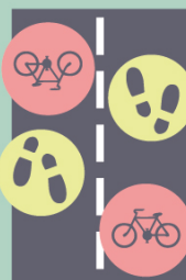
Dle místní situace* Vpravo

*zákon předpokládá chodce vlevo, místní zvyklosti se ale často liší