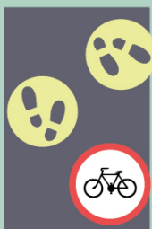
Kdekoliv Vede kolo