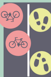
Na své části Na své části vpravo

*zákon předpokládá chodce vlevo, místní zvyklosti se ale často liší