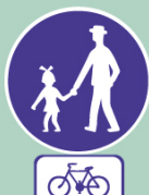
Chodník s povolenou jízdou kol