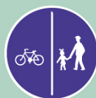
Stezka pro chodce a cyklisty, dělená