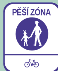
Pěší zóna s povolenou jízdou kol