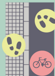
Kdekoliv Ve vozovce, je-li odlišena (max 20 km/h)