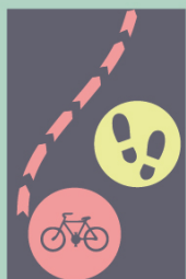
Objeví-li se chodci, objet ohleduplně.