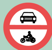
Zákaz vjezdu motorových vozidel