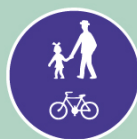
Stezka pro chodce a cyklisty, společná