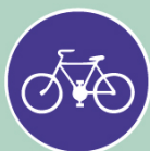
Stezka pro cyklisty