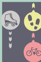
Vpravo Vpravo (max 20 km/h)