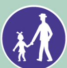
Stezka pro chodce (chodník)