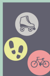
Vlevo Vpravo Vlevo, vpravo